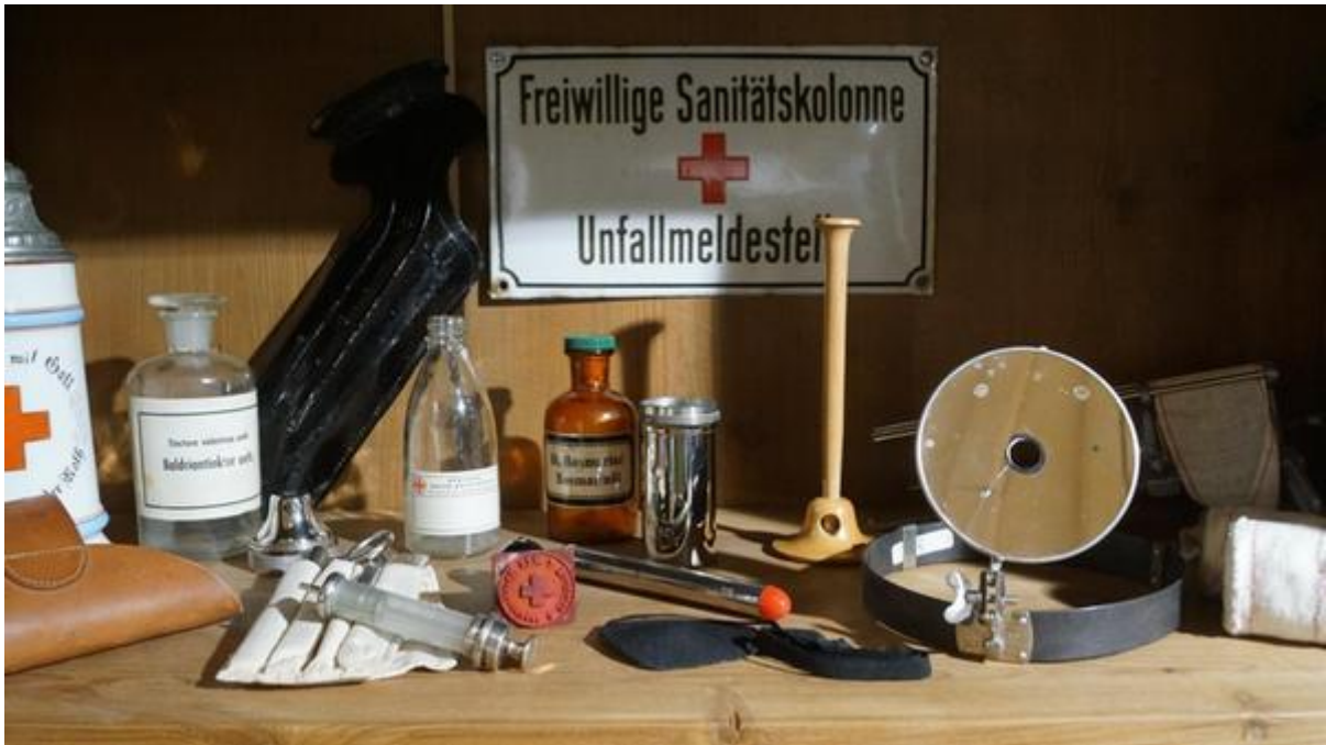
Die neue Ausstellung im Museum34 präsentiert nicht nur Tragen und andere Rettungsgeräte, sondern auch diverser Zubehör sowie Fotos und Zeitungsberichte über das BRK.