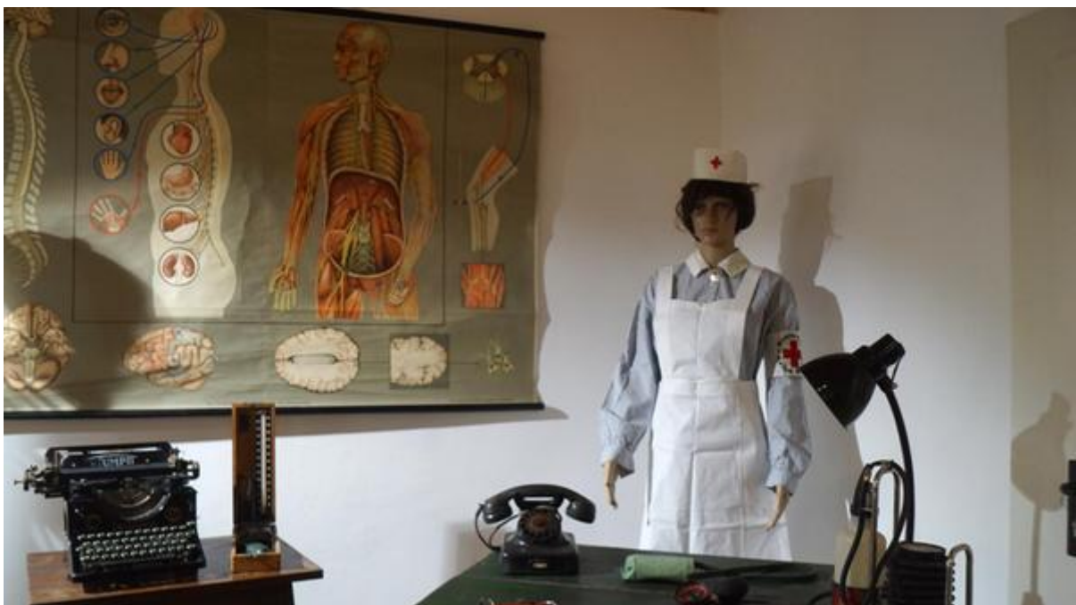
Für die Rotkreuz-Schwester wurde im zweiten Stock des Bürgerhauses ein kleines Büro eingerichtet. Daneben sind eine Krankentrage auf Rädern und ein betagter Brutkasten ausgestellt.