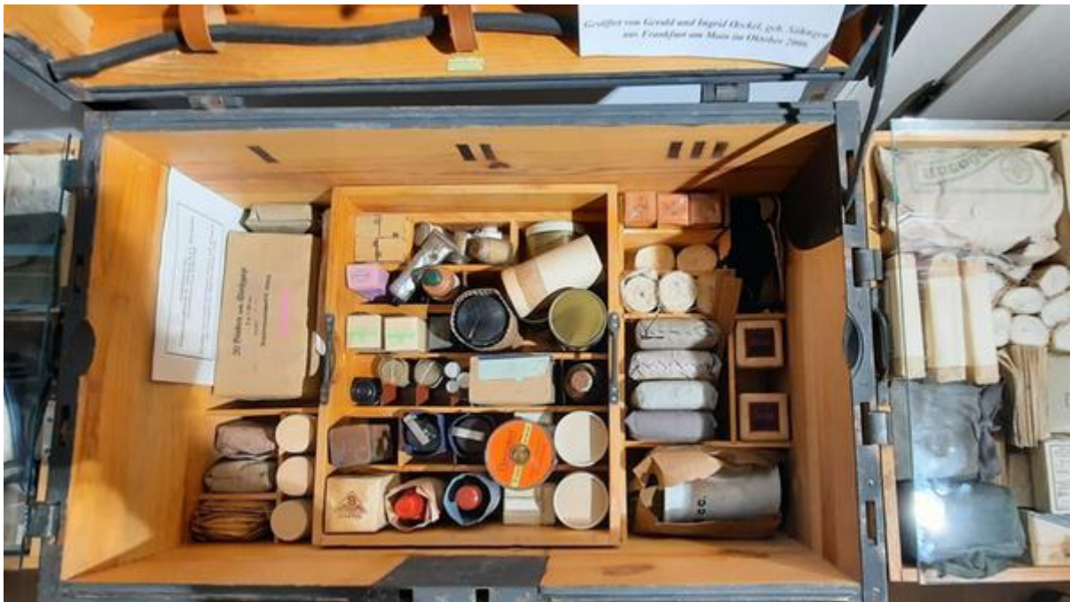
Der Sanitätskasten K50 ist ein Behälter mit Erste-Hilfe-Material für so genannte Großschadenslagen mit mehreren Verletzten. Heute wird der K50 aus Alu angefertigt.